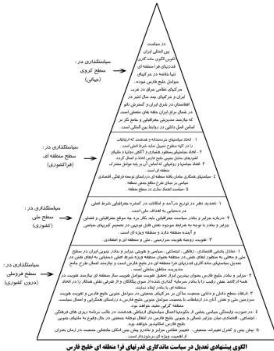
الگوی پیشنهادی تعدیل در سیاست ماندگاری قدرتهای فرا منطقه ای خلیج فارس